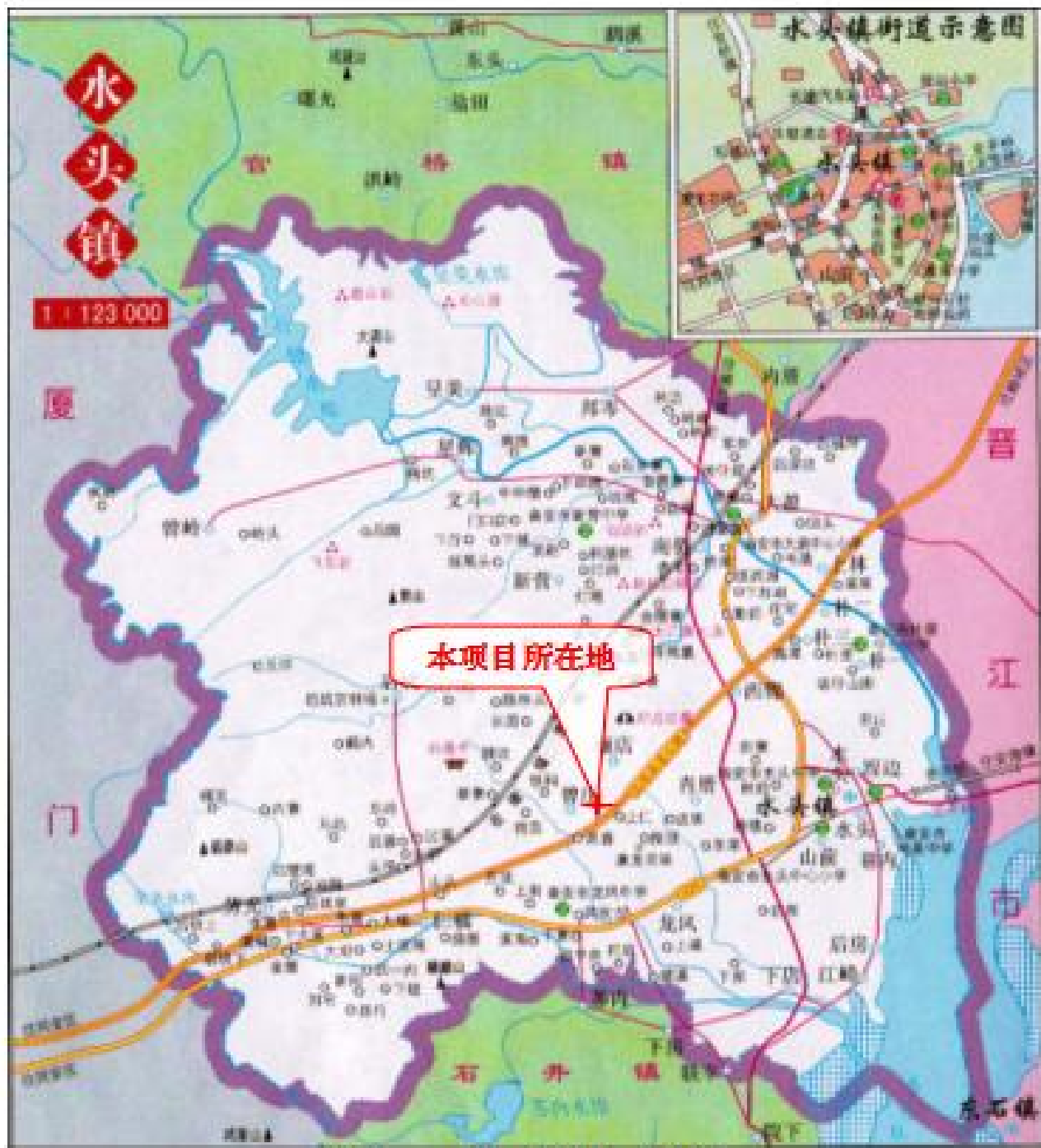
附图1 建设项目地理位置图